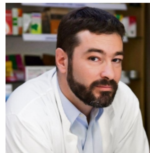
Γιάννης Δαγρές ΥΠΟΨΗΦΙΟΣ ΠΡΟΕΔΡΟΣ